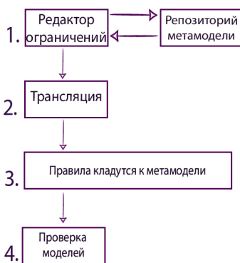
Рис. 3: Схема работы системы проверки ограничений.

На данный момент редактор позволяет построить граф по данным, находящимся в репозитории, создавать вершины и ребра в графе и добавлять их в репозиторий. Помимо своего визуального представления каждый узел хранит дополнительную информацию, которую можно посмотреть через редактор с помощью клика мышкой по нужному узлу. Редактор позволяет заменить текущее представление вершины на изображение в формате .png, но эти изменения не сохраняются в репозиторий. Сейчас при любых изменениях графа его визуальное представление перестраивается заново. Исправление этого недочета занимает продолжительное время из-за отсутствия документации по библиотеке MSAGL.